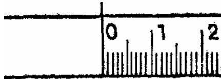
Slika 2: Skica početnog dijela mjerila kojemu je početna temeljna oznaka ljestvice krajnja crta